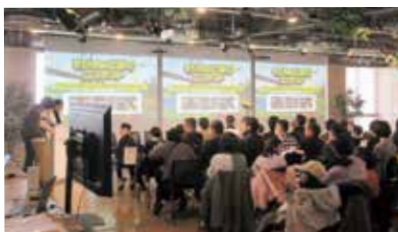
コンテスト表彰式

建設産業の魅力の発見・興味を喚起し、将来の担い手確保に繋げる取組として、小中学生に人気の、まちづくりや建築物・構造物等を自由に制作可能なゲーム「Minecraft（マイクラフト）」を活用したインフラデザインコンテストを開催します。