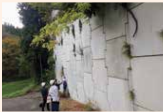
現地調査への職員派遣