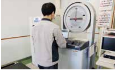
コンクリートの圧縮強度試験