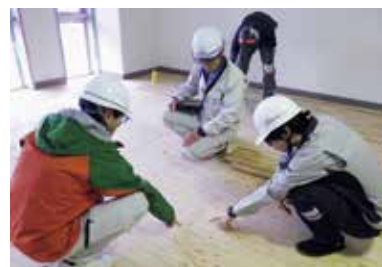
施工管理(サーラ孺恋建設工事)