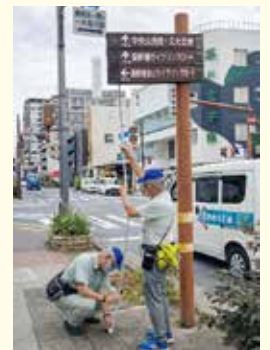
愛着施設見回り隊による点検