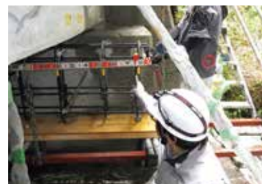
積算・施工管理(橋梁補修工事)