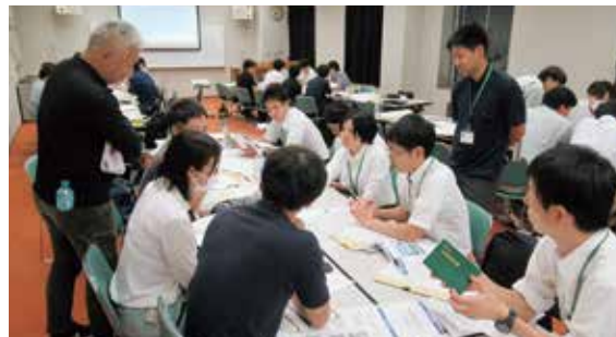
行政基礎(災害特別研修)