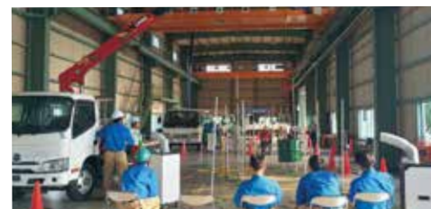
小型移動式クレーン運転技能講習会