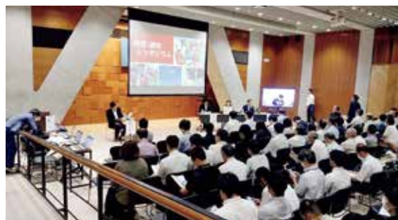
防災減災シンポジウム