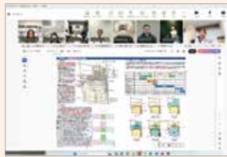
公共建築物の設計打合せ (WEB)