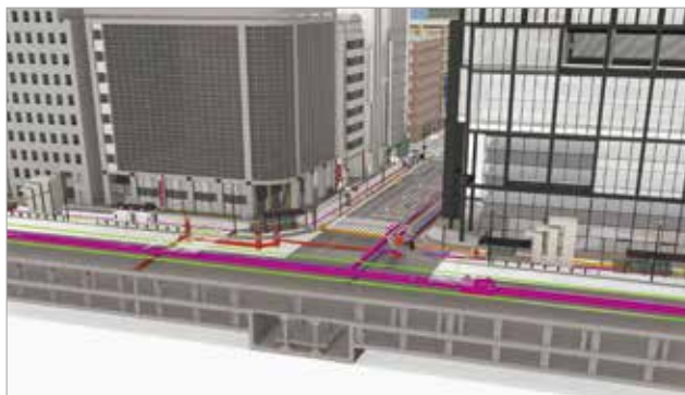
地下施設の可視化イメージ