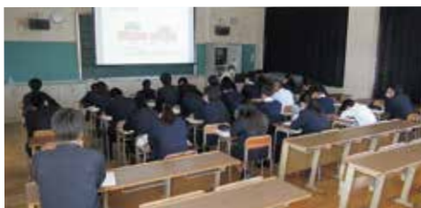
2級土木施工管理技士講座