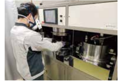
アスファルト合材の抽出試験

供試体集荷サービスを行っています。ぜひご利用ください。詳しくは HP をご覧ください。