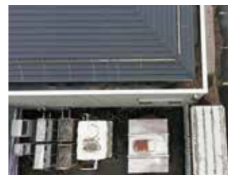
ドローンによる屋根の劣化調査